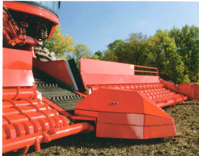
Hydraulisch antriebener Schiebekeil