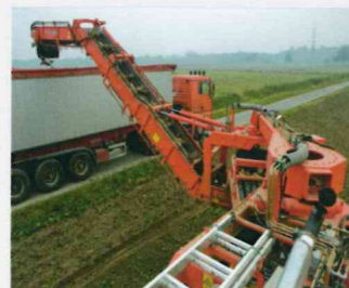
Das Überladeband ist über 2 hydraulische Drehkränze 300° nach rechts bzw. links schwenkbar